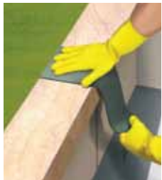
Τοποθετήστε την ταινία στη θέση της