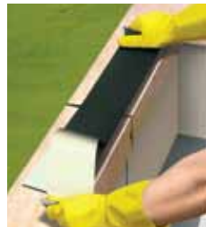
Αφαιρέστε την προστατευτική μεμβράνη