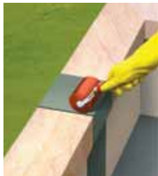
Πιέστε την ταινία με ρολό πίεσης

Επιφάνειες που είναι σκονισμένες ή / και μεγάλης απορροφητικότητας θα πρέπει πρώτα να ασταρώνονται με ασφαλτικό γαλάκτωμα Sika Icol® A ( \pm 250 \text{ gr/m}^2 ) Σε περιπτώσεις εφαρμογών σε θερμοκρασία < 5^\circ\text{C} , θα πρέπει να προθερμανθούν τόσο η ταινία Sika MultiSeal® όσο και το υπόστρωμα.