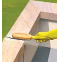
Καθαρίστε και απομακρύνετε την σκόνη

Η επιφάνεια του υποστρώματος θα πρέπει να είναι καθαρή, χωρίς σκόνη, στεγνή, λεία και απαλλαγμένη από ρύπους.